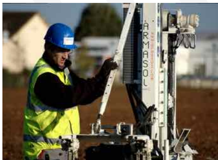
Fimurex 2016 © - Conception : Dalfredo - Document non contractuel

10 Apporter des garanties supplémentaires pour votre construction : Nos études vous apporteront une assurance supplémentaire (garantie décennale).