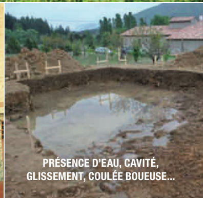
PRÉSENCE D'EAU, CAVITÉ, GLISSEMENT, COULÉE BOUEUSE...